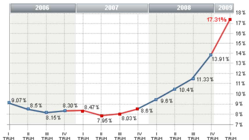
Tasa del Paro según EPA (INE)

Por sectores, el de servicios concentró el mayor número de desempleados, con 1.446.400, tras sumar 602.200 desde marzo de 2008 (299.000 en el trimestre), seguido por el colectivo que perdió su empleo hace más de un año con 977.500 parados (420.300 más en un año y 188.400 en el trimestre).